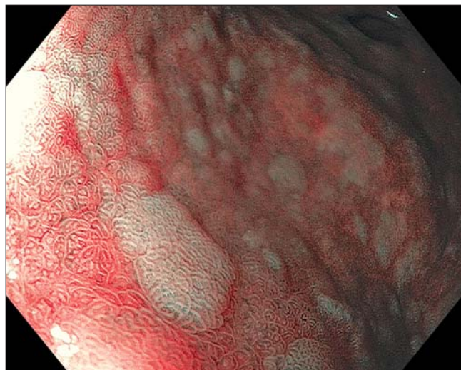
Рис. 1. Эндоскопическая фотография. Тонкокишечная метаплазия слизистой оболочки тела желудка. Эндоскопическое исследование в узком спектре света (NBI), с высоким увеличением ( \times 115 ). Хромокопия 1,5% уксусной кислотой